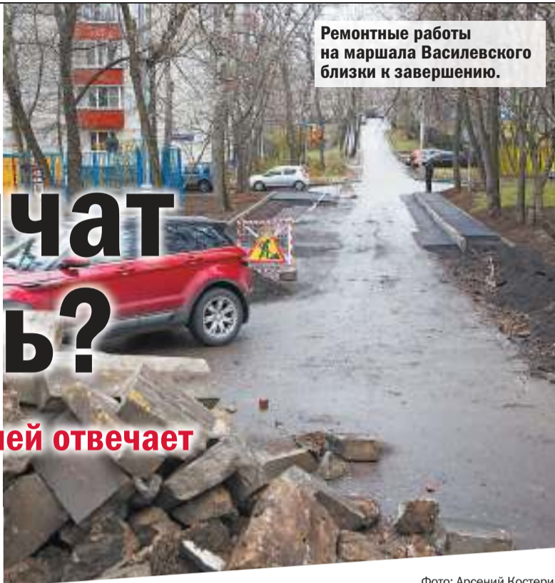
Ремонтные работы на маршала Василевского близки к завершению.

Есть вопросы? Пишите нам info@aif.ru +7 (495) 646 57 57