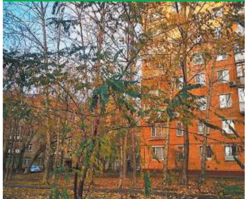
Золотая осень побывала и в Щукино. А вы фотографировали район? Присылайте свои снимки в паблик «Щукино» (facebook.com/vshukino).