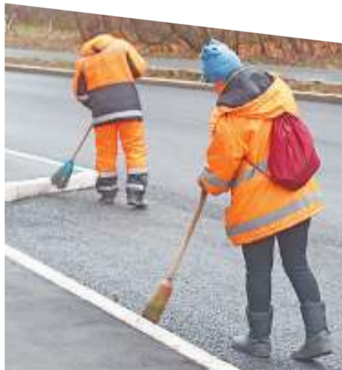
В городе есть чёткие правила по уборке. И на их несоблюдение можно жаловаться.